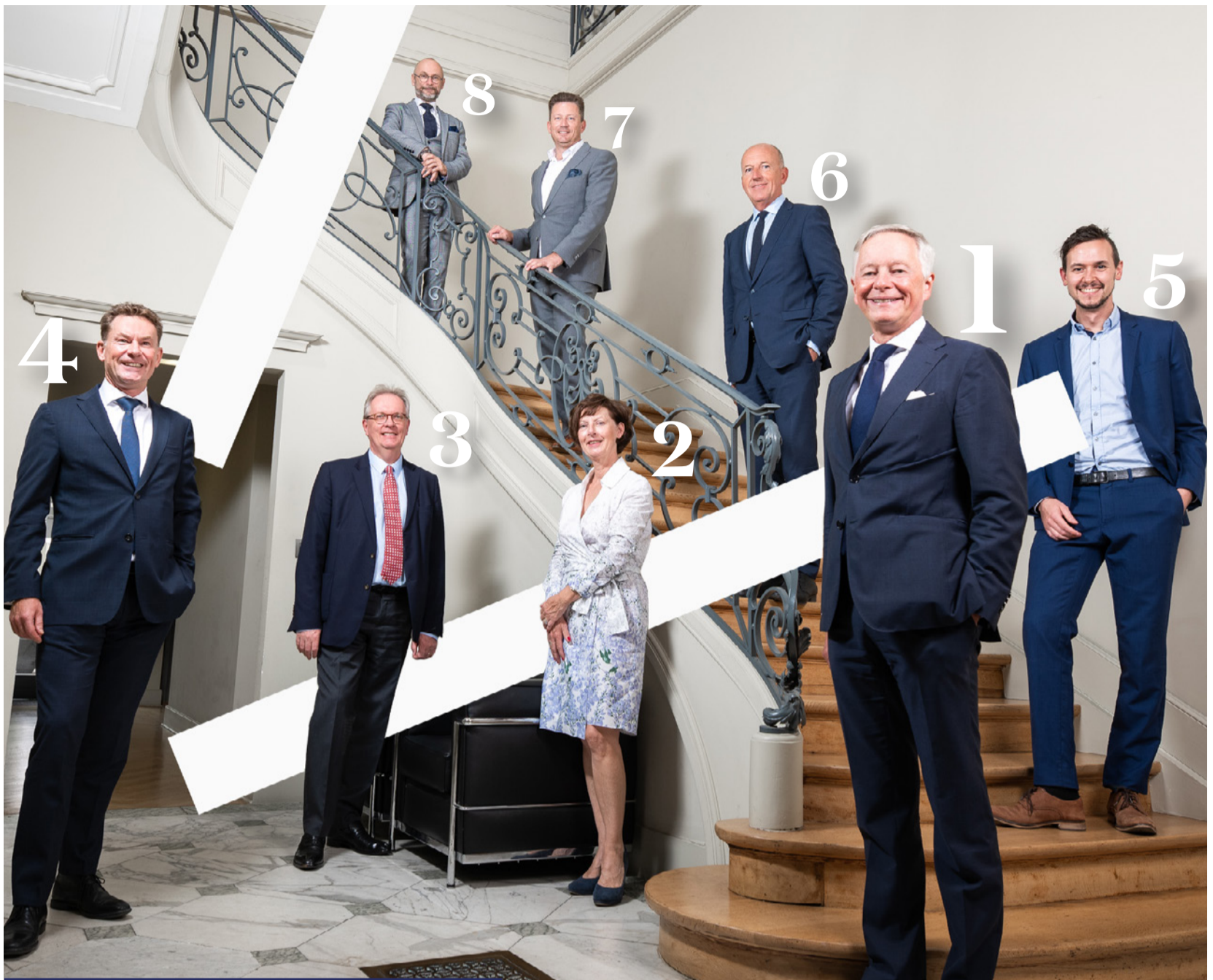
/ Wie is wie binnen het bestuur van de OVV